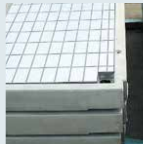
← Massivbalkon mit Belag und Aussparung für Wasserablauf.