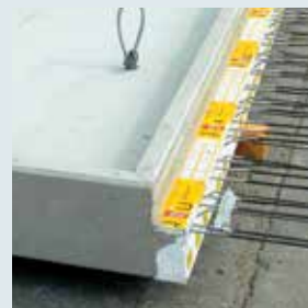
← Massivbalkon mit umlaufender Aufkantung über Deckenhöhe und Isokorb.