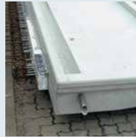
← Massivbalkon mit Aufkantung, Wärmedämmelement (Isokorb), innenliegender Rinne und Wasserspeicher.