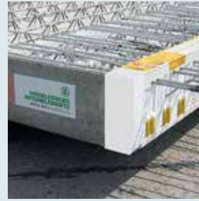
← Balkon als Halbfertigteil mit Faseraufkantung und Isokorb.